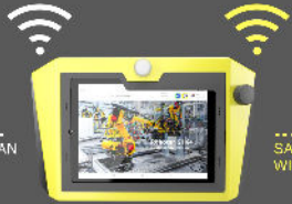
HMI MOBILE SAFETY PANEL SP200