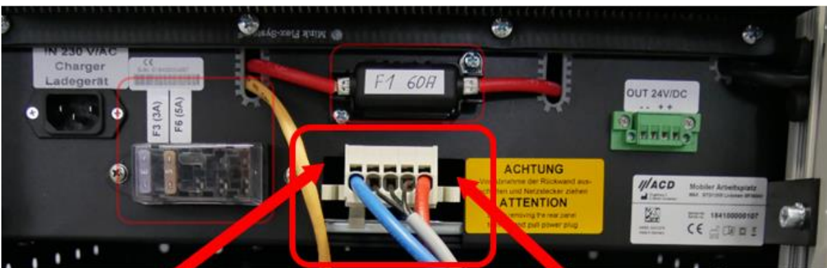
Abbildung 2: Batteriestecker ausstecken