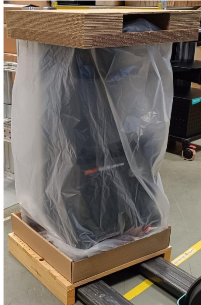
Abbildung 7: Arbeitsplatte abdecken