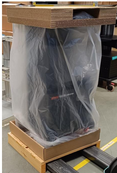
Figure 7: Covering the work surface