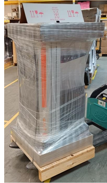
Figure 8: Wrapping the MAX BE with foil

If you need additional support, please contact our support hotline: