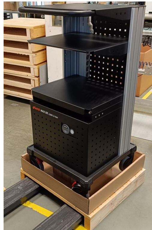
Abbildung 5: MAX BE Transport mit Hubwagen