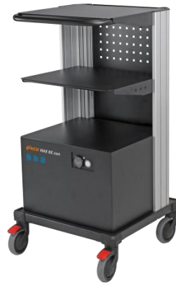
MAX BE TK