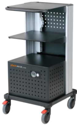
MAX BE Li-Ionen