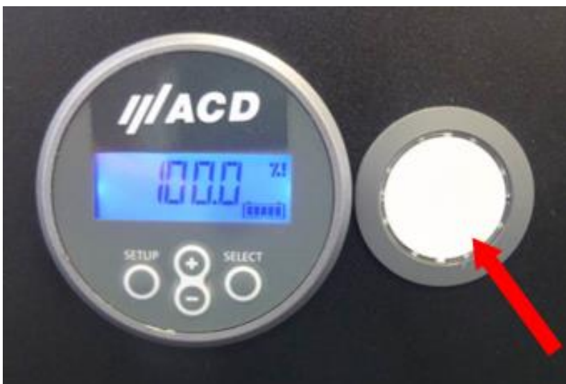
Figure 1: Turning off the MAX BE