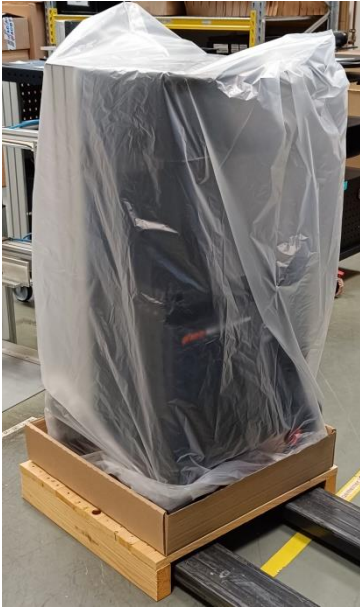
Figure 6: Covering the MAX BE with foil