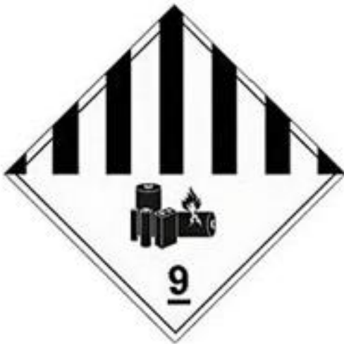
Figure 3: Hazardous goods sticker class 9

In both cases a hazardous goods sticker 100 x 100 mm for lithium-ion batteries class 9 must be affixed to the package on the outside so it is clearly visible.