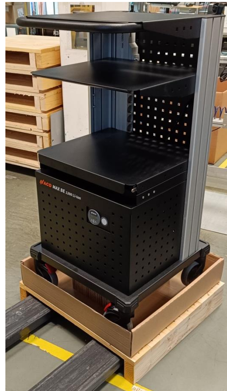
Figure 5: MAX BE transport with lift truck