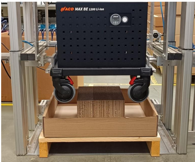
Figure 4: Packaging the MAX BE on a pallet