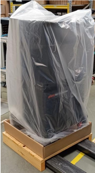
Abbildung 6: MAX BE mit Folie abdecken